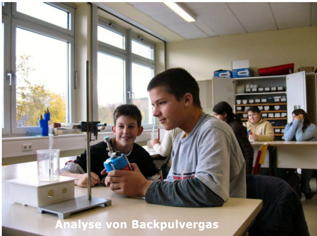
Analyse von Backpulvergas

An den Theatertagen, die jedes Jahr im Mai stattfinden, öffnen wir unsere Schule für andere Förder- und Regelschule; wir laden die Schulen aus der Umgebung ein, bei uns Theater zu spielen oder unsere Stücke oder die Aufführungen anderer Schulen als Zuschauer zu verfolgen.