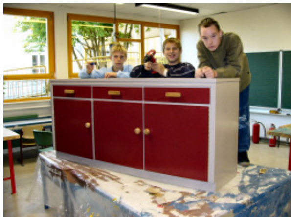
Restaurierung eines Schrankes

Unsere Schüler sollen in den Kulturtechniken Lesen, Schreiben, Rechnen und Computernutzung so weit gefördert werden und darüber hinaus so vielfältige fachspezifische und allgemein bildende Kenntnisse, Fähigkeiten und Fertigkeiten erwerben, dass sie ein selbstständiges Leben als mündige Privatperson, Wirtschaftssubjekt und Staatsbürger führen können. Dafür ist es notwendig, bei der Inhaltsauswahl auf Lebensbedeutsamkeit zu achten und in der methodischen Umsetzung einerseits den Bezug zur Lebenswirklichkeit erfahrbar zu machen, andererseits die spezifischen Lernvoraussetzungen des Einzelnen zu berücksichtigen und die Schülerinnen und Schüler individuell zu fördern.